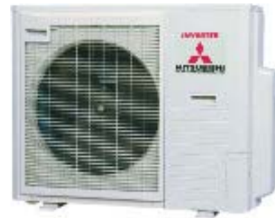
Außengerät SCM 80 ZG S

Besonderheiten: Die Gewerberäume werden ausschließlich durch das SX-System beheizt.