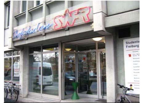
Verwaltungsgebäude im Stadtzentrum

Das installierte MITSUBISHI Heavy Ind. KXS®-System ist die richtige Wahl, wenn ein betriebssicheres Klimasystem nachträglich in einen vorhandenen Gebäudekomplex kostengünstig integriert werden soll. Durch die energiesparende Voll-Invertertechnologie mit stufenloser Leistungsregelung der kompakten Außengeräte, ist eine Klimatisierung mit niedrigen Betriebskosten möglich. Optional lässt sich die Steuerung und Regelung des Multisplit-Raumklimasystems durch die STULZ CompTrol® -Leittechnik ergänzen.