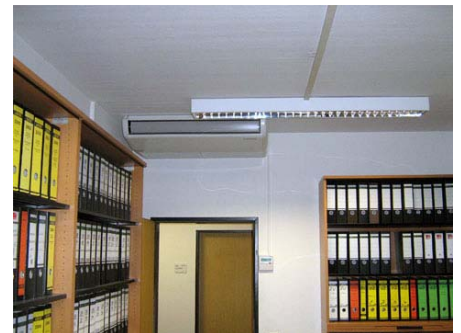
Ansicht eines Unterdeckengerätes mit Kabelfernbedienung