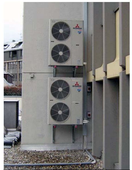
Auf dem Dach installierte Außengeräte