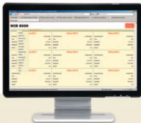
Tutto sott'occhio: interfaccia Web WIB 8000