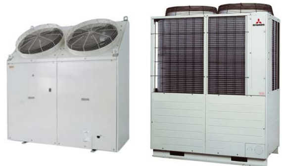
Außengeräte FDCP / FDCA

2 x FDCP 224 HKX 1 x FDCP 280 HKX 1 x FDCA 335 HKX