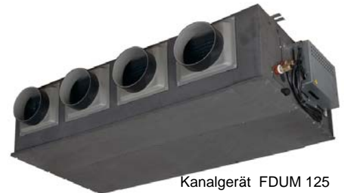
Kanalgerät FDUM 125