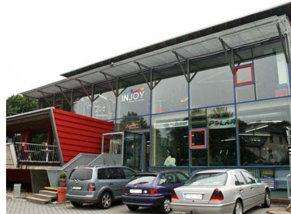
Das Injoy Fitness-Studio in Weilburg

Das Ergebnis ist eine zugfreie Kühlung mittels Kanalgerät und einem Gewebelüftungsschlauch in Sonderanfertigung.