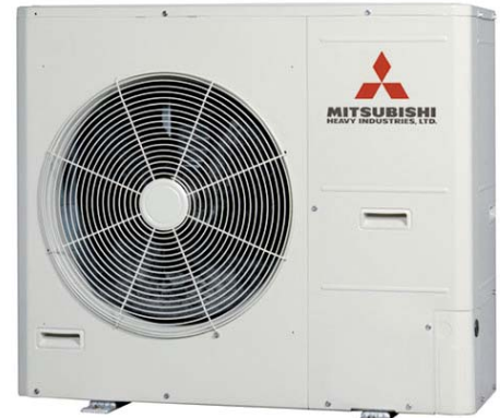
Außengerät FDC 125 VS