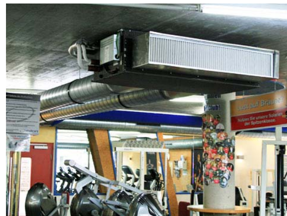
Kanalgerät über Trainingsfläche