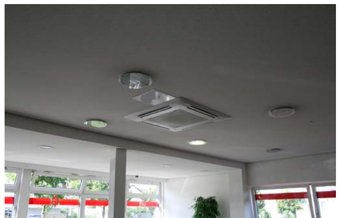
Innengerät im Schalterraum