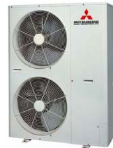
Außengerät FDCA 140 HKX

Installierte Kälteleistung: 15 kW Installierte Heizleistung: 17 kW