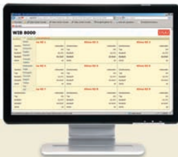
Todo a simple vista: Interfaz Web WIB 8000