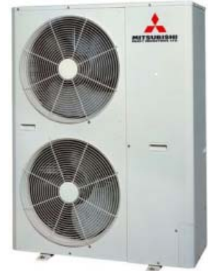
Außengerät FDCA 140 HKX