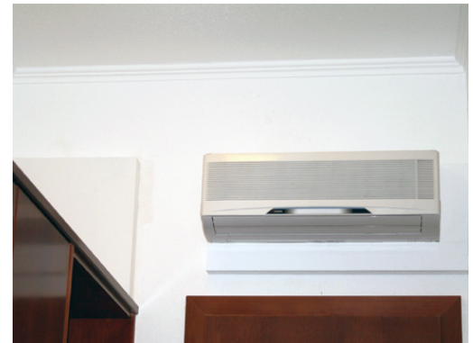
Wandgerät zum Kühlen und Heizen