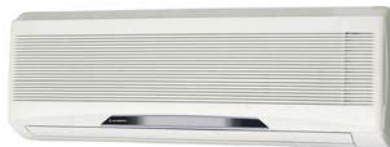
Innengerät Wandgerät FDKA 22