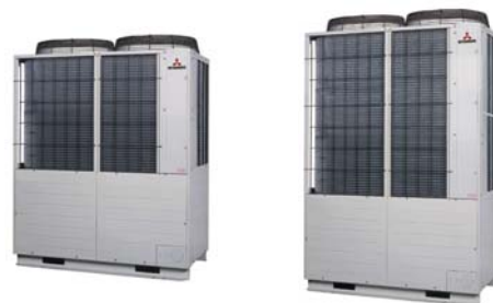
Außengerät FDCA 450 HKX