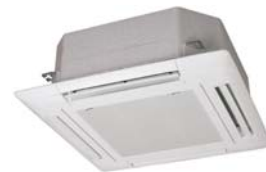
Innengerät Deckenkassette FDTA 45