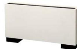
Innengerät Truhengerät FDFL 36