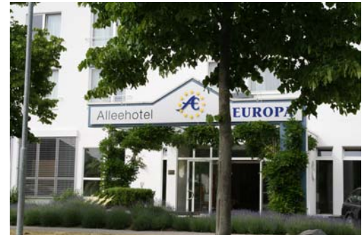
Eingang zum Alleehotel Europa

Das MITSUBISHI Heavy Ind. KXS ® -System ist die richtige Lösung, wenn es gilt, Gebäude mit speziellen Anforderungen (wie z.B. dieses Hotel) optimal zu klimatisieren und dadurch einen hohen Komfort zu gewährleisten. Zudem sorgt die CompTrol ZLT ® -Software von STULZ für eine einfache Überwachung des Komplettsystems. Perfektes Klima komplett aus einer Hand.