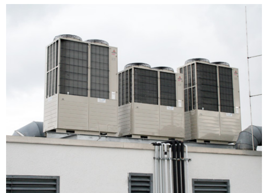
Auf dem Dach installierte Außengeräte