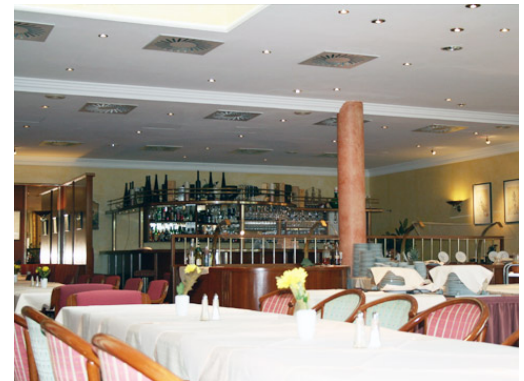
Deckenkassetten im Konferenzraum