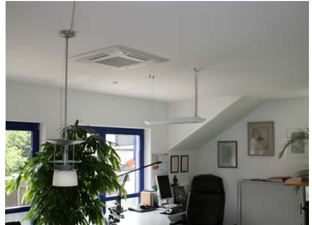
Im Büroraum integriertes Innengerät (Deckenkassette)

Weiterhin kann auf Wunsch auch eine Energiekostenabrechnung, z.B für einzelne Mietbereiche, über dieses System automatisch erfolgen.